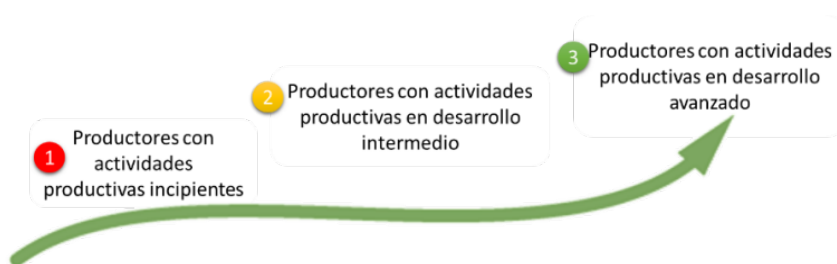
Tabla I Niveles de las asociaciones identificadas en territorio