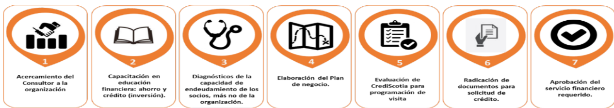
Gráfico 2. Proceso de asistencia a los productores para la gestión de recursos de crédito

Con la creación de un modelo crediticio denominado “Fondo de Inversión Inclusiva Solidaria - FIIS”, las empresas del grupo Scotiabank (Scotiabank y CrediScotia Financiera) en alianza con CARE Perú, se propusieron apoyar las inversiones de las asociaciones dedicadas a la prestación de servicios o comercialización de productos, con el propósito de bancarizar a la población beneficiada del proyecto; de tal forma se dispuso una asesoría en crédito, para apoyar a los beneficiarios en la formulación de un proyecto o un plan de negocio. En el gráfico